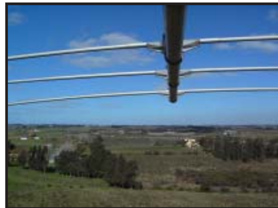
Foto: Vista del horizonte desde la torre n°1 y con la antena Mosley sobre nuestras cabezas.