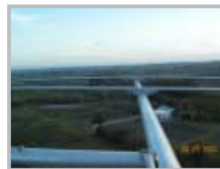
- Vista desde la Antena Mosley -