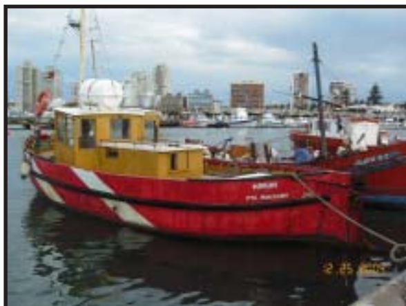
Foto: "La Marina" embarcación de DINARA, aquí realizamos los primeros traslados de avanzada.

No podemos empezar a hablar de la Isla de Lobos sin mencionar Punta del Este, brevemente les cuento que es un lugar realmente de ensueño, hoy densamente poblada en especial en este mes de enero donde concurren miles de turistas. Es una península que se incrusta en el Océano Atlántico apuntando a la Isla de Lobos en su extremo sur este, llena de altas construcciones no deja de brillar duran-