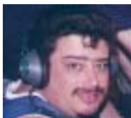
Por: Horacio CX6AAZ