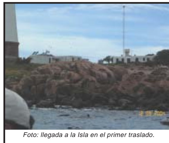
Foto: Llegada a la Isla en el primer traslado.

Sobre las Tormentas eléctricas se puede decir que son poco frecuentes y se observan mayoritariamente en el invierno. Durante las tormentas o granizadas se destaca que los Lobos Marinos se alejan hacia el mar, los que solo