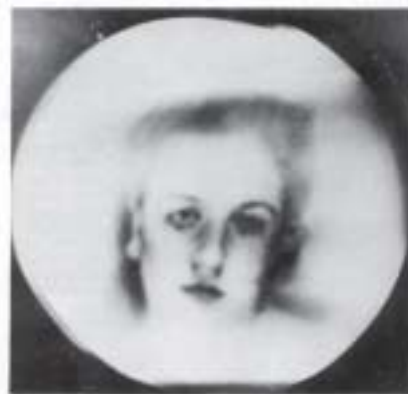
La primera imagen en la TV de América Latina: