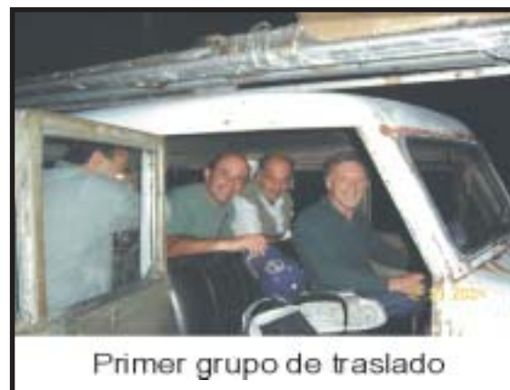
Primer grupo de traslado

Desde hace un tiempo Julio EA5XX uruguayo radicado