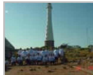
- CW5R Isla de Lobos -