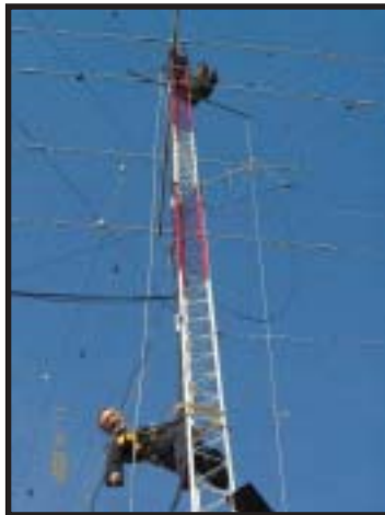
Foto: Trabajo de antenas en la torre n°1 por parte de Lupo CX2ABC y Ricardo CX6ACY en esos momentos cambiando unos coaxiales.