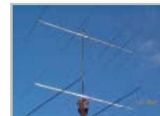
- Nuestras Antenas enfasadas -