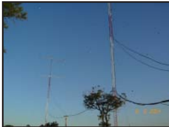
Las antenas para 10 metros enfasadas nos han dado muy buenos resultados